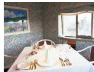
マウンテンビュー