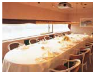
サンセットテラス