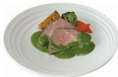
●写真: 豚肩ロースのコンフィ