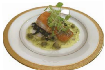
●写真: サルモンムニエル香草バターソース