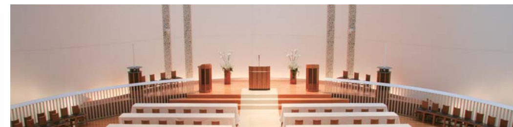
愛と平和の教会 フィオーレ FIORE:花の聖堂

蒼い地中海の海原と白波をイメージした空間では 展示会・展覧会や立食パーティー、ウエルカム ドリンク提供など日常とは違うお洒落な会場に変化します。