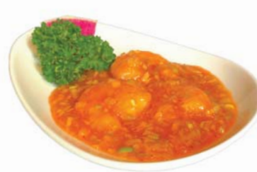
●写真: 海老チリソース煮