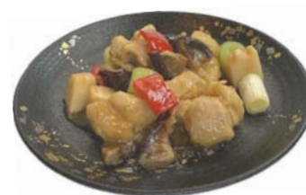
●写真: 若鶏と筍の炒め