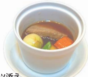
●写真: 牛バラ肉と香味野菜の煮