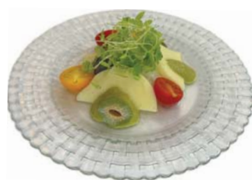
●写真: ミニトマトとモッツァレラのカプレーゼ