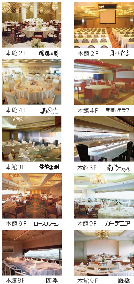
本館 2F 鳳凰の間